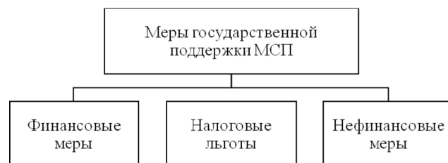
Рис. 4. Основные меры государственной поддержки МСП 13

ного заказа. Субъекты МСП создают консорциумы для выполнения крупных государственных заказов, которые отдельному малому предприятию недоступны 12 . Субъекты МСП не только получают доступ к крупным государственным заказам, но и государственную поддержку для осуществления своей предпринимательской деятельности. На рисунке 4 приведены основные меры государственной поддержки МСП.