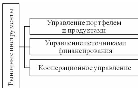
Рис. 3. Основные рыночные инструменты для обеспечения устойчивости МСП 9

На рисунке 3 приведены основные рыночные инструменты для обеспечения устойчивости МСП.