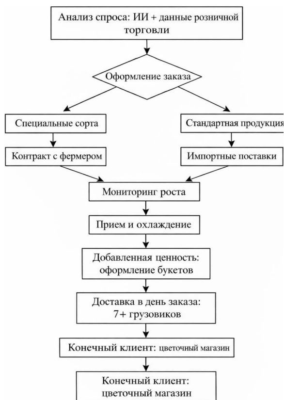
Рис. 2. Интегрированная модель формирования ассортимента и цепочки создания стоимости 23

Управление ассортиментом на оптовой базе во многом представляет собой стратегическую игру на опережение. Модель компании иллюстрирует эволюцию от узкой специализации, сосредоточенной на цветах, к полноценной структуре «гипермаркета для флористов», способной одновременно удовлетворять спрос как на экономичные позиции, так и на премиальные эксклюзивные сорта. Такая стратегия позволяет сбалансировать массовый и премиальный сегменты, сократить потери и гибко реагировать на колебания потребительского спроса (рис. 2).