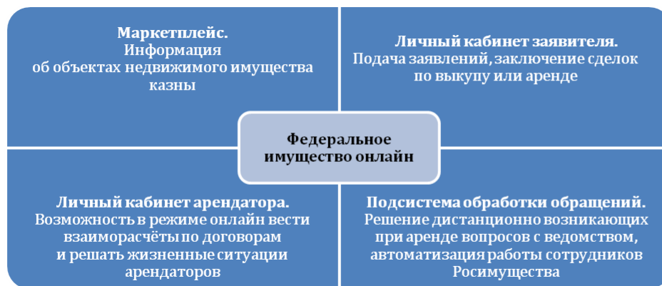
Рис. 2. Структура сервиса Росимущества «Федеральное имущество онлайн» 20

ля в ежегодном плане Росимущества — «Совпадение сведений реестра федерального имущества и иных государственных информационных систем, содержащих сведения об объектах федерального имущества». Согласно плану деятельности Росимущества на 2025 21 год и плановый период 2026–2030 годов 22 показатель должен составить 90% по итогам 2025 года, 93% и 95,5% в 2026 и 2027 годах соответственно.